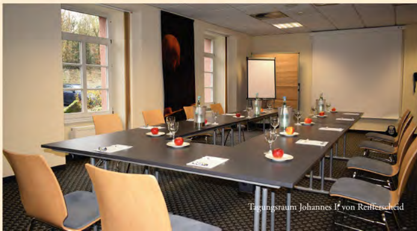
Tagungsraum Johannes I. von Reifferscheid